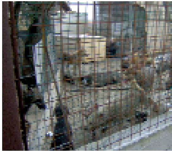
Il canile abusivo di Torre a Mare (Bari) andato a fuoco la scorsa estate. Nel rogo sono rimasti uccisi decine di cani ma molti altri sono stati salvati dai volontari LAV e di altre associazioni.

Le novità introdotte dalla Legge finanziaria 2008