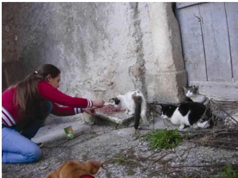
3 Una volontaria distribuisce il cibo ai gatti recuperati

Senza questo impegno straordinario, centinaia di gatti smarriti, abbandonati o precedentemente accuditi sul territorio da persone oramai sfollate o decedute a causa del sisma, sarebbero morti di stenti.