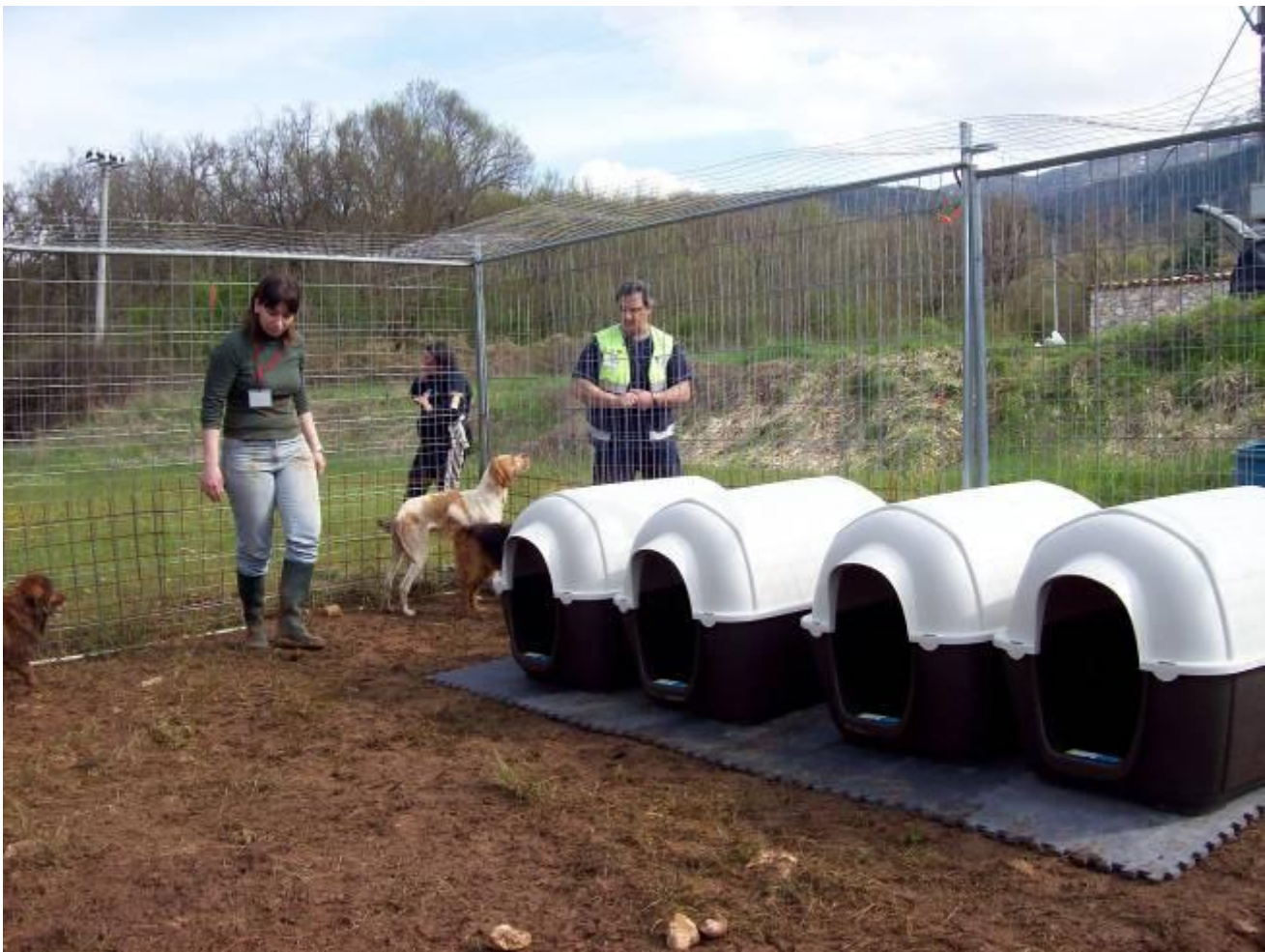
1 I volontari LAV costruiscono un recinto per i cani recuperati sul territorio

Diverse Sedi LAV hanno allestito tavoli e centri di raccolta aiuti per animali che successivamente hanno recapitato nelle zone terremotate.