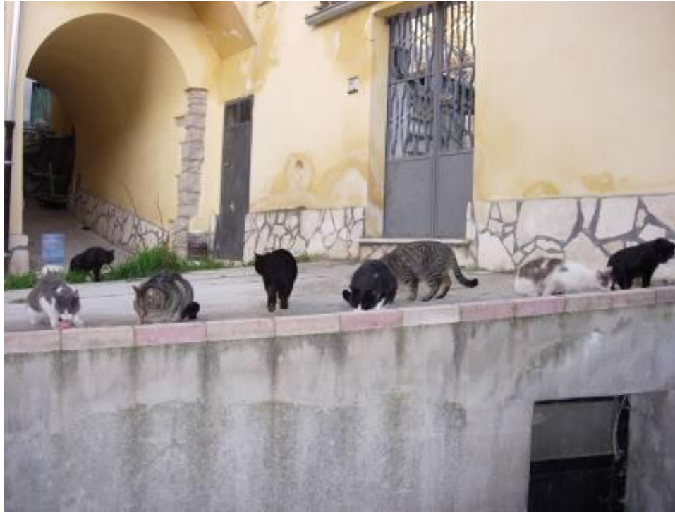
4 Colonia felina

Attraverso le collaborazioni con ASL di Forlì, e con i veterinari dell'Associazione Nazionale Alpini di Parma e Reggio Emilia, nonché con la Lega Pro Animale, e in coordinamento con i Servizi Veterinari ASL, nell'autunno 2009, sono stati sterilizzati circa 400 gatti. Nonostante questo primo ottimo risultato, ci sono ancora zone importanti (es. zona Parco Velino Sirente in cui sono segnalati circa 150 gatti adulti nella zona compresa fra i paesi di S.Maria del Ponte, Tione, Castel di Ieri, Acciano, S.Pio) in cui è necessario intraprendere uno sforzo supplementare attraverso una seconda fase del piano di sterilizzazione. Nella seconda parte del Piano si potrà procedere alla sterilizzazione di alcuni gatti che nella prima fase non erano stati catturati o si sono aggregati successivamente alle colonie esistenti.