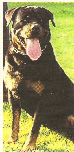
Un esemplare di rottweiler

mente attenta nell'applicazione della legge 189/2004 che ha rivoluzionato la materia della tutela penale degli animali. «La condanna dimostra che maltrattare i propri animali non è solo un atto moralmente inaccettabile, ma è un reato punito, quanto all'art. 544 bis e ter del codice penale, anche con la reclusione. Chiunque decida di accogliere presso di sé un animale», sostiene, «deve farlo con la consapevolezza di essere moralmente e giuridicamente responsabile del suo benessere». ♦